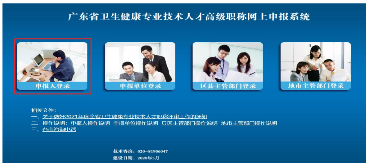
图 2 申报系统首页