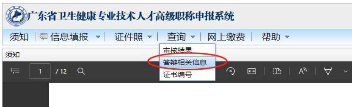
图 4 查询答辩相关信息

进入申报系统后，点击“查询”→“答辩相关信息”，打开查询对话框，查看并记录答辩时间、测试会议号、测试会议密码、答辩会议号、答辩会议密码、会议管理员姓名及电话等信息，如图 4 所示。测试会议号和答辩会议号相同，测试会议密码和答辩会议密码相同。