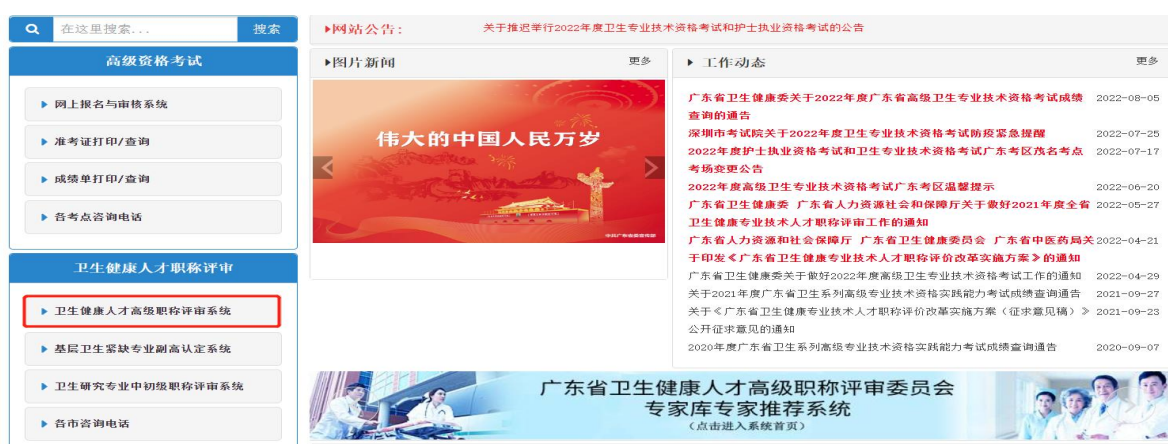
图 1 省卫生人才网首页系统位置

参加答辩人员按通知规定的查询时间，访问广东卫生人才网（网址： http://www.gdwsrsrc.net ），打开《广东省卫生健康专业技术人才高级职称网上申报系统》，如图 1 所示。